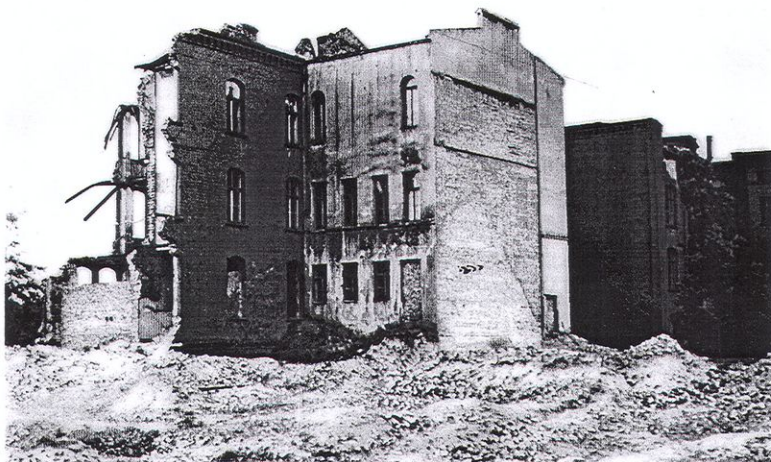
Fot. 3. Ruiny dawnej szkoły widok elewacji zachodniej.