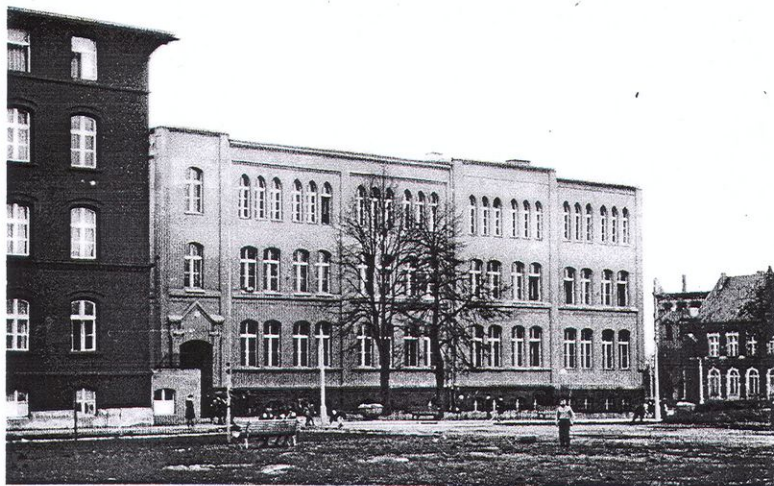
Fot. 4. Budynek dawnej szkoły po odbudowie.