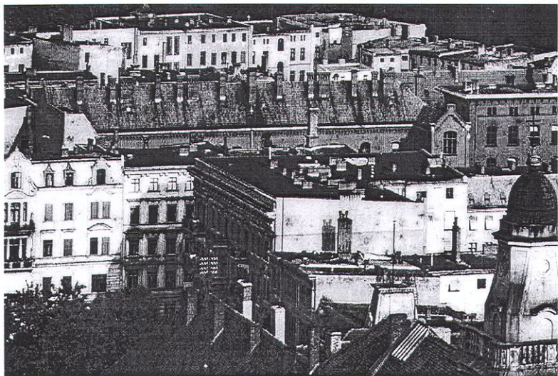
Fot. 2. Widok panoramy Głogowa z wieży Ratusza – początek XX w.